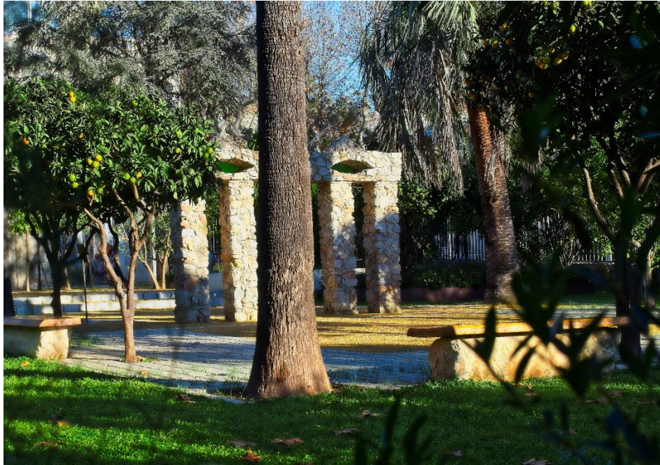
Bientôt une meilleure vue ...