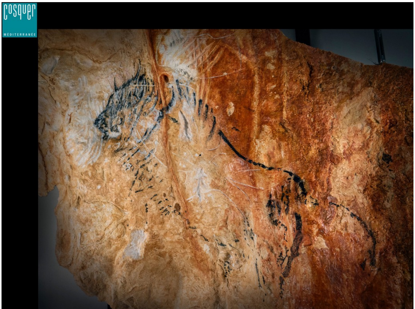
Restitution, représentations d'animaux

Dernière précision, il est inutile d'amener tuba et palmes, la visite se fait en wagonnets.