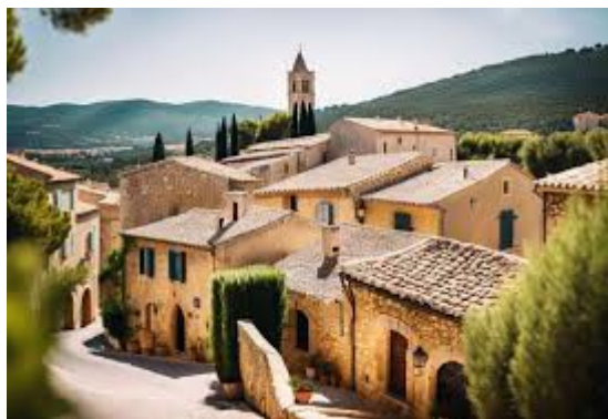
Village du Castellet