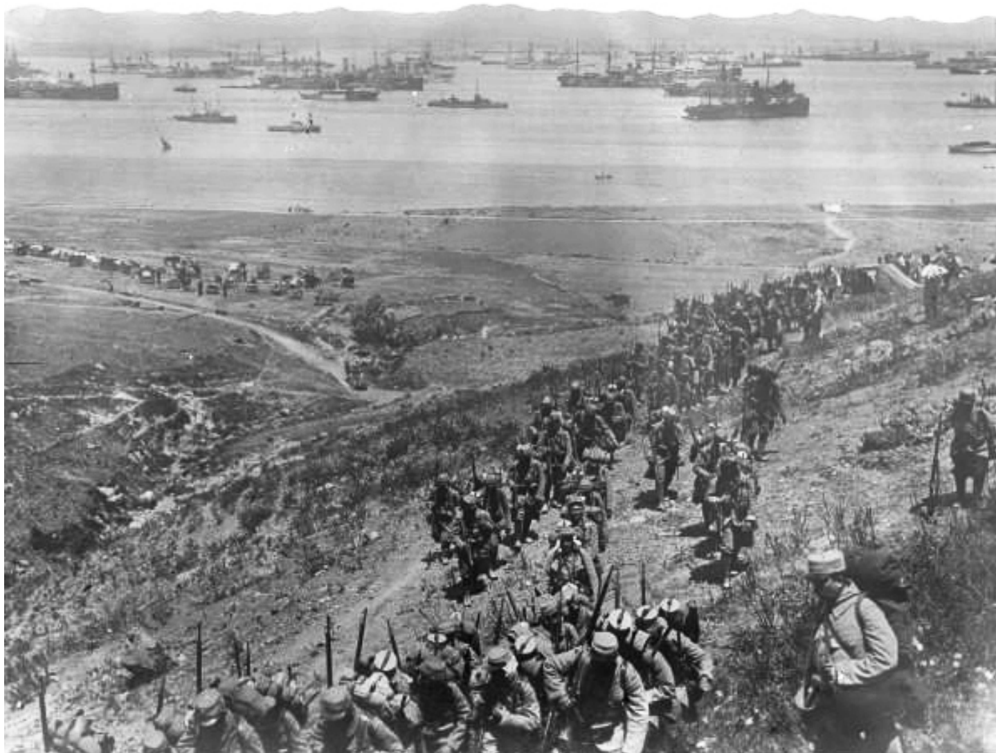
Débarquement des troupes françaises sur l'île de Lemnos

Il fallait donc neutraliser les côtes avant de reprendre l'opération et donc débarquer. Monsieur Ghiglione va dès lors s'appuyer sur le récit d'un participant, le grand-père de son épouse. Celui-ci, depuis Toulon, avait été, comme un bon nombre de soldats méridionaux, dirigé sur l'île grecque de Lemnos lieu de rassemblement.