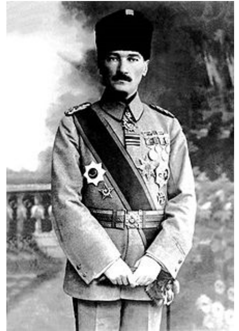
Mustapha Kemal « Atatürk »

Une troisième opération sur la côte asiatique, avec l'armée d'Orient du général Sarrail resta à l'état de projet.