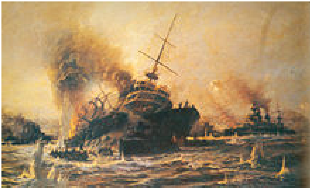
Nauffrage du cuirassé « Commandant Bouvet »

Il présenta le déroulement de l'attaque navale du 18 mars 1915, se soldant par un échec et la perte de plusieurs bâtiments anglais et français (le cuirassé Bouvet coula avec six cents hommes). Le détroit était miné, des forts avaient été construits, dotés d'une artillerie efficace depuis les hauteurs du rivage.