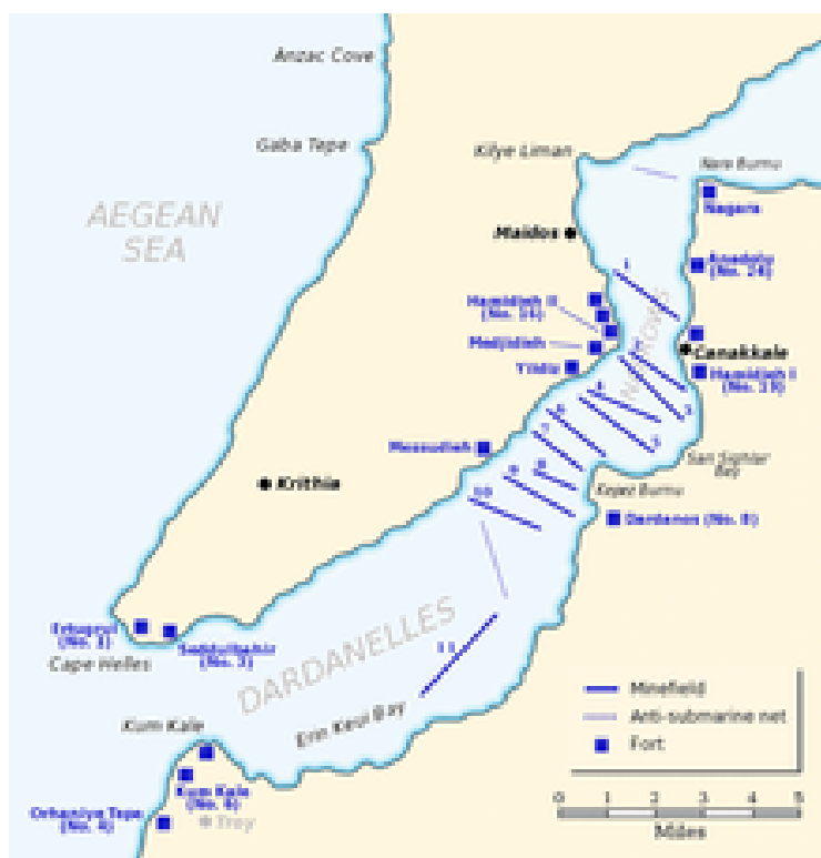
Carte des champs de mines et des fortifications ottomanes dans les Dardanelles

Le conférencier présenta ensuite, à l'aide de cartes et de plans détaillés, les lieux caractérisés par des rives relativement montagneuses. Il signala la proximité du site antique de Troie.