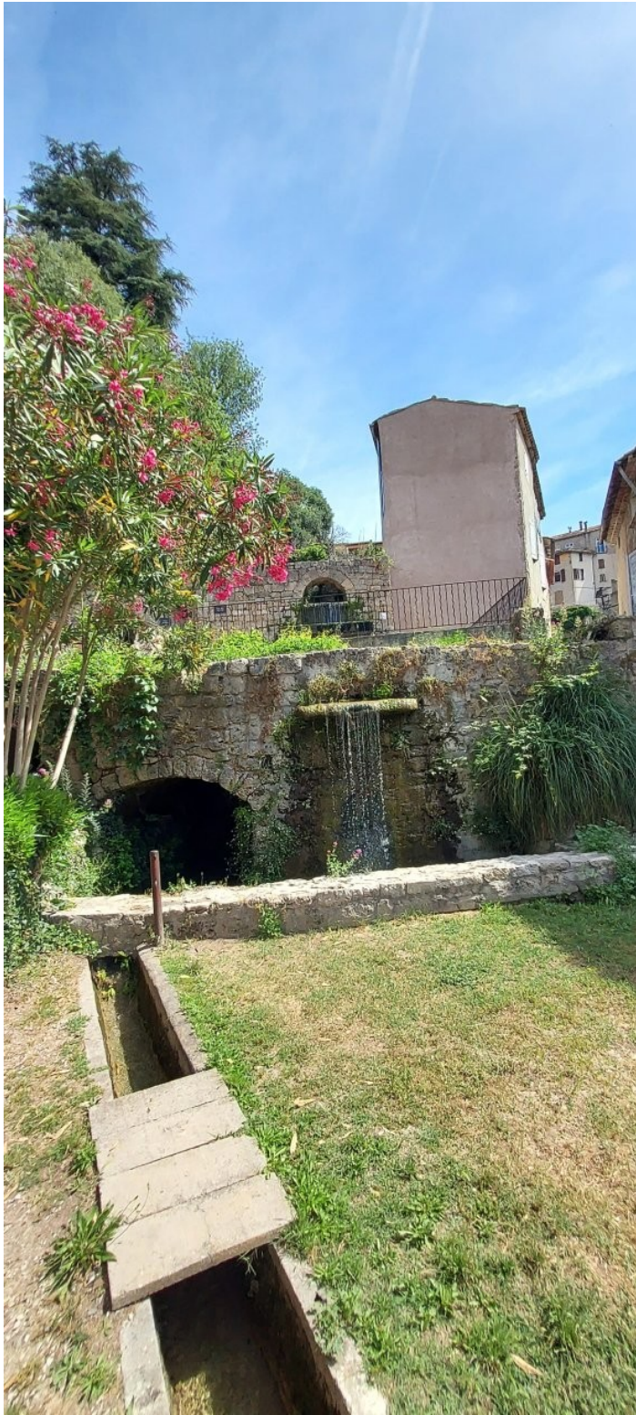
Cà coule de source