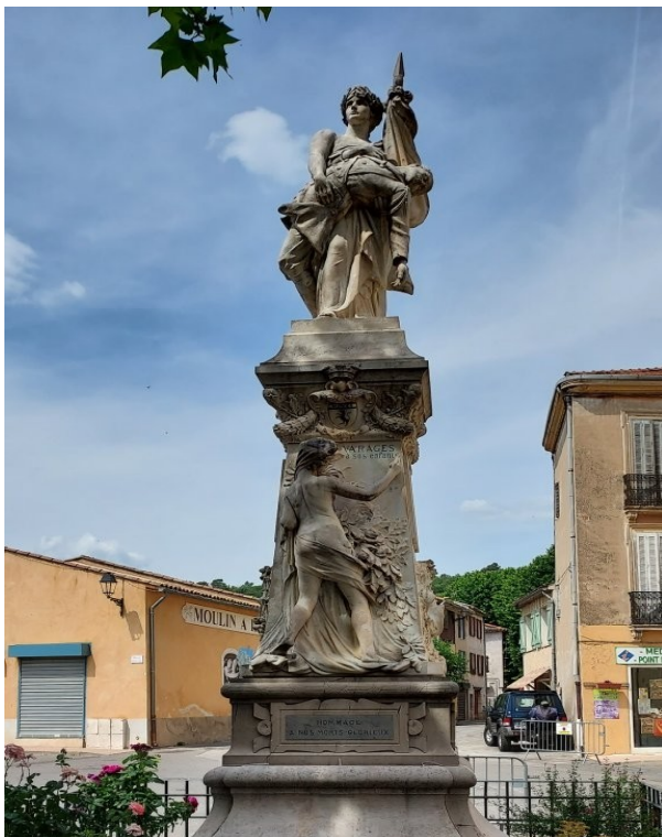
Varages M aux M