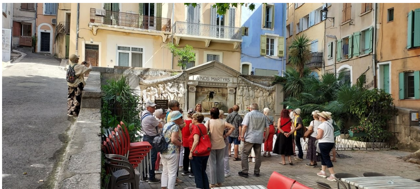
Barjols monuments aux morts