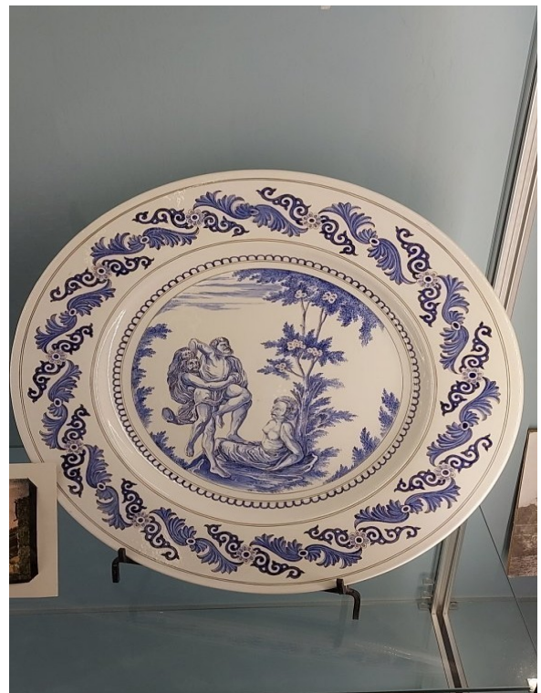
Varages un plat