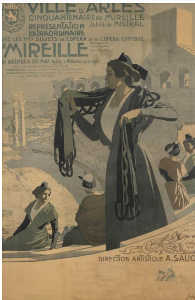
Affiche réalisée pour les 50 ans de Mireille, aux arènes d'Arles.