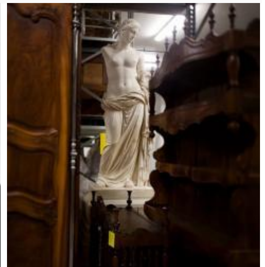
Un siècle d'évolution

Nous ne manquerons pas de passer devant la tour de Luma avec son architecture particulière !!