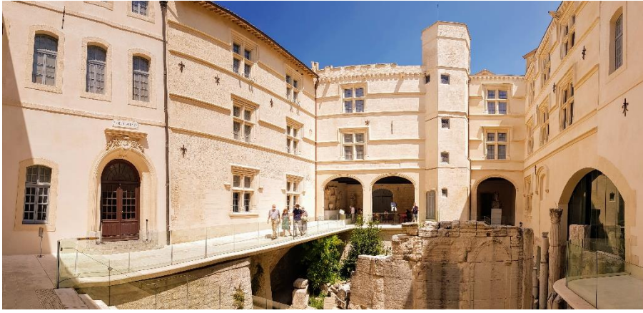
Cour intérieure du Musée Arlaten