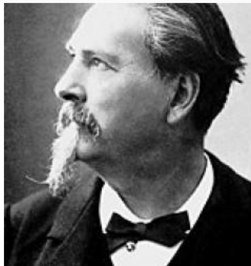
Du mas au prix Nobel.