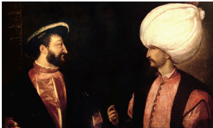
François Ier et SOLIMAN le Magnifique

En 1453, dernier vestige de l'empire Byzantin d'Orient, Constantinople passe sous leur autorité. De 1512 à 1566, SOLIMAN LE MAGNIFIQUE, dirige un empire s'étendant depuis l'Afrique du Nord (sauf le Maroc), l'Égypte, le Moyen-Orient, la Péninsule Arabe et celle des Balkans jusqu'aux portes de Vienne qu'il assiègera en vain en 1529.