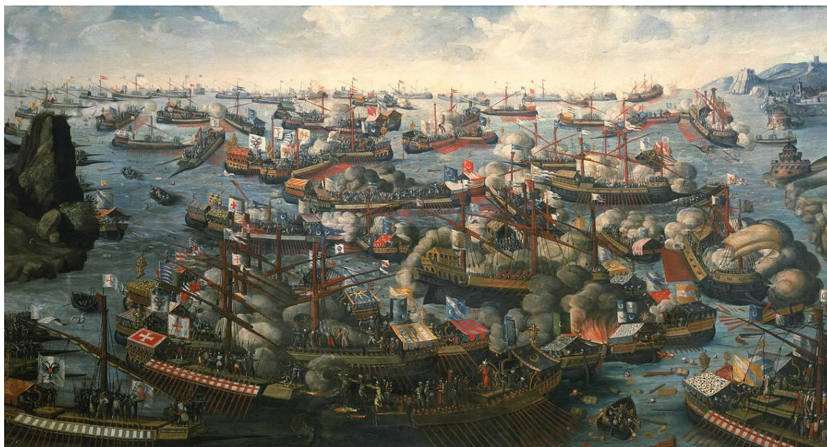
Bataille de Lépante 1571

Mais avec la défaite navale de LEPANTE en 1571, un lent recul de cette puissance va débiter et marquera les 18 ème et 19 ème siècles. La Grèce deviendra indépendante en 1830, l’Egypte autonome en 1840. Les révolutionnaires « Jeunes Turcs » de 1909, n’arrêteront pas la chute mais réaliseront une alliance avec l’Allemagne aux redoutables conséquences.