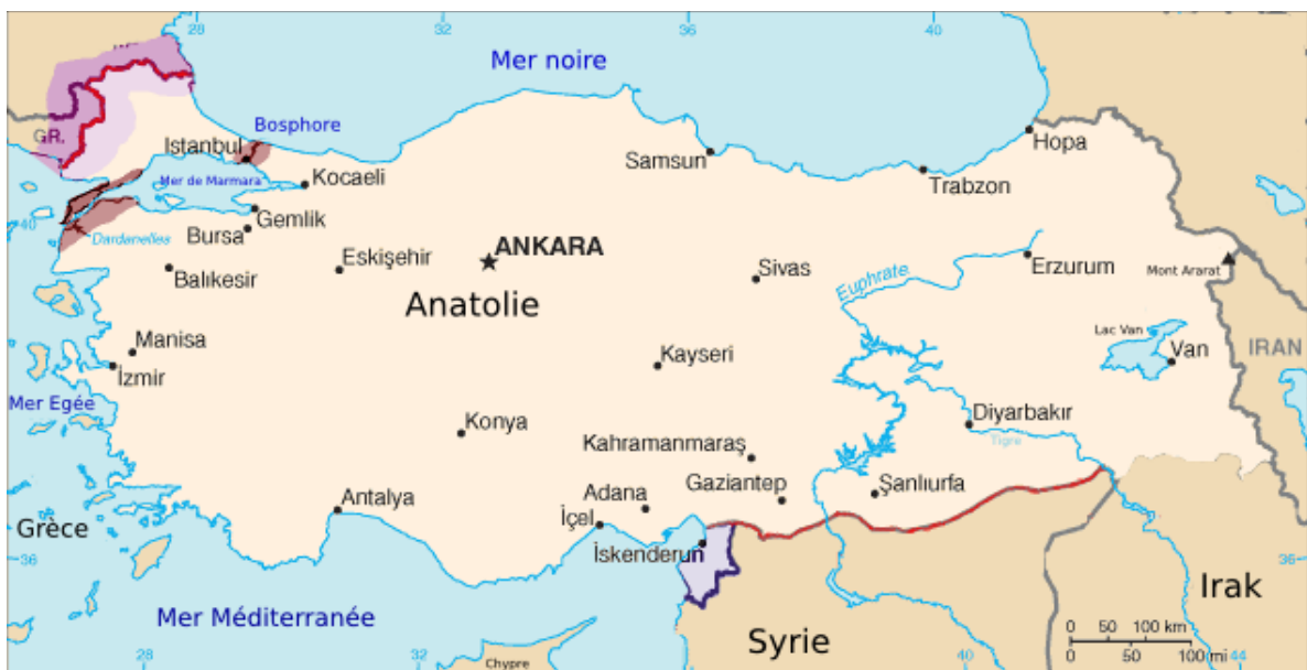
Turquie après le traité de Lausanne 1923

Le partage des dépouilles va être stoppé par l'entrée en scène de MUSTAPHA KEMAL. Né à SALONIQUE, alors Turquie en 1887, militaire de carrière, il commande avec succès une unité sur le front des Dardanelles en 1915. Général en 1916, il prend en 1919 la tête d'un mouvement nationaliste hostile aux décisions des vainqueurs. Il s'oppose militairement mais illégalement aux grecs, il réunit à AGORA, future ANKARA, une Assemblée Nationale qui le désigne comme chef. Il reconquiert tout le territoire de la Turquie actuelle, négocie avec les anglais et rentre à Constantinople où il dépose le sultan le 1 er novembre 1922. C'est la fin d'une monarchie de six siècles. Le traité de LAUSANNE, en juillet 1923 rend à la Turquie SMYRNE et la THRACE européenne et démilitarise les détroits. Des transferts de population, de force, ont lieu entre l'Asie Mineure et la Grèce et vice-versa. La République Turque est proclamée en 1923 et Mustafa KEMAL en sera le premier Président. Quant au dernier Sultan, évacué par un cuirassé anglais vers Malte, il finira ses jours à San Remo. La Turquie Moderne était née.