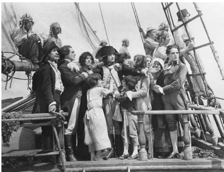
Napoléon et sa famille fuyant la Corse vu par Abel Gance , Paris, 1927

On connaît très peu de choses sur les premières années de sa vie. En 1793, à l'âge de treize ans, elle suivit sa mère, frères et soeurs, dans la fuite vers le Continent, après le choix familial de la Révolution. Elle sera vite courtisée d'abord, au château Salé à Antibes où habite la famille après le siège de Toulon, par Junot (devenu aide de camp de Bonaparte), puis par le Conventionnel Stanislas Fréron, dont Bonaparte ne veut pas entendre parler. Pour couper court à cette idylle, Bonaparte fait venir Paolina au château de Mombello, près de Milan, où il règne déjà comme un proconsul.