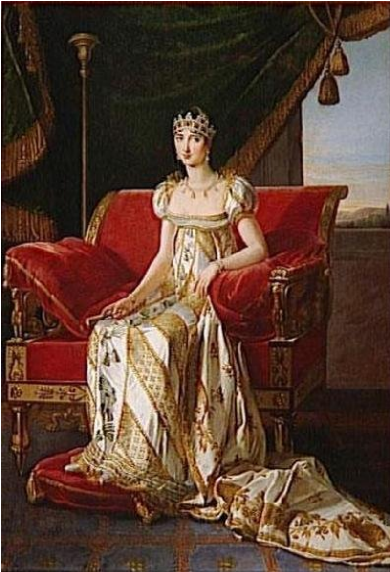
Pauline Bonaparte, princesse Borghese (1780-1825) Peinture de Marie Guilhelmine BENOIST au musée national du château de Fontainebleau

Sœur préférée de Napoléon 1 er , immortalisée par la statue de Canova et célèbre surtout par le nombre de ses amants, Pauline Bonaparte est née dans la maison familiale d'Ajaccio le 20 octobre 1780.