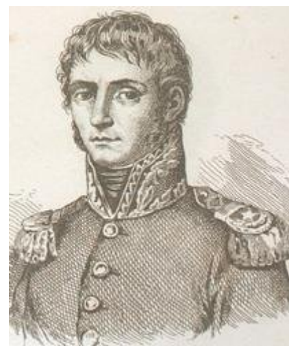
Charles Victoire Emmanuel Leclerc

Le mariage est célébré le 14 juin 1797. L'année suivante, ils ont un fils prénommé Dermid, prénom issu de la poésie d'Ossian.