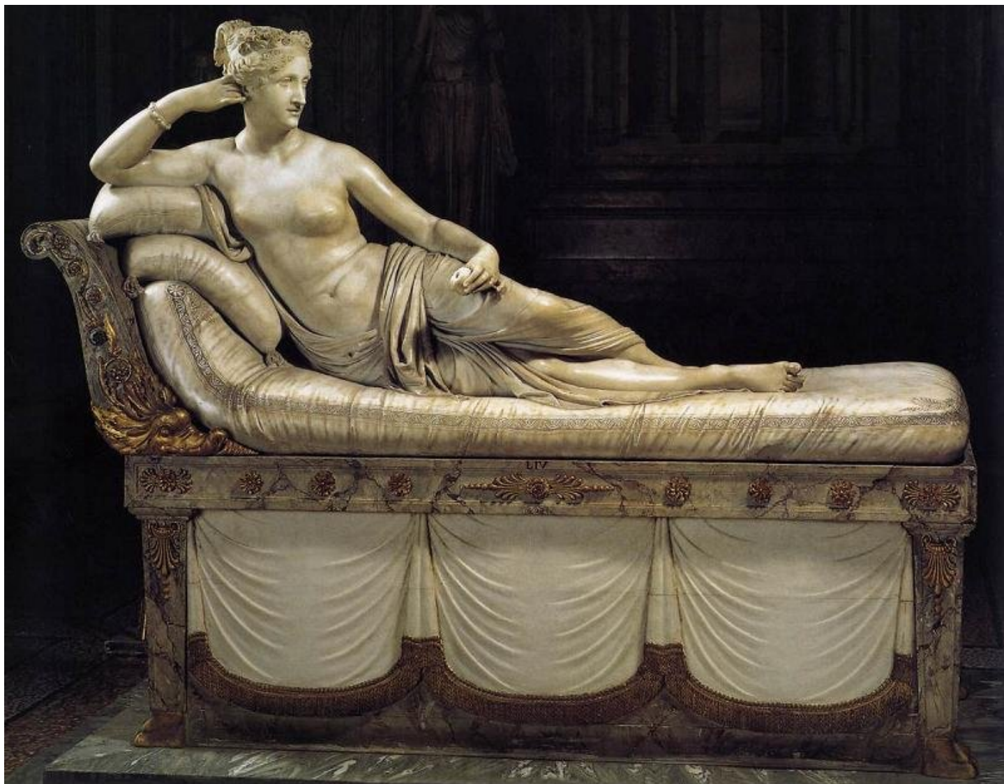
La Vénus Victrix de Canova

Elle était une des plus belles femmes de son temps. Le sculpteur Canova a immortalisé la beauté victorieuse de Pauline Borghèse en une sublime Vénus de marbre, couchée sur un divan, simplement vêtue d'un drap recouvrant ses jambes. Cette Vénus Victrix se trouve à la Galerie Borghèse à Rome. L'autre oeuvre de Canova, La Galatea pour laquelle elle aurait posé, se trouve au musée de San Martino (original) et des Mulini (copie) à l'île d'Elbe.