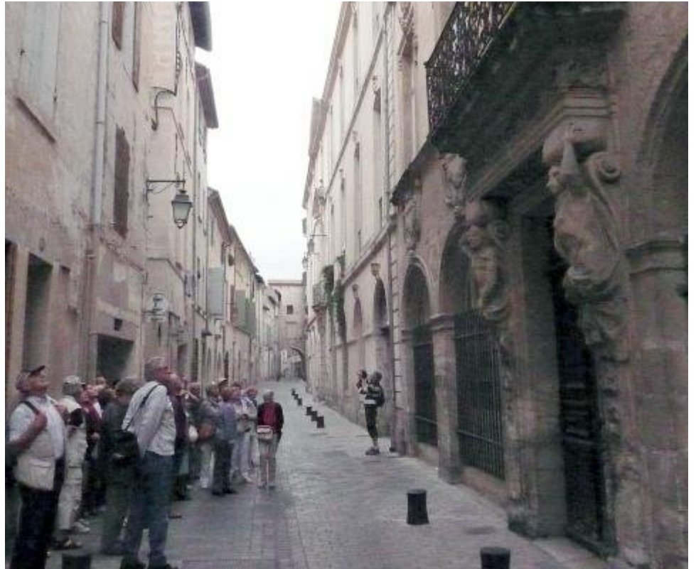
Notre groupe visite la ville vieille : à droite l'hôtel de Margallier

Cette foire exceptionnelle a duré du XIII ème siècle au XIX ème siècle.