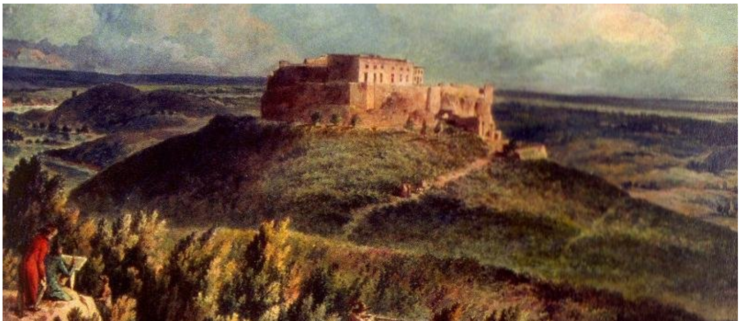
Peinture du château au XVIII ème siècle