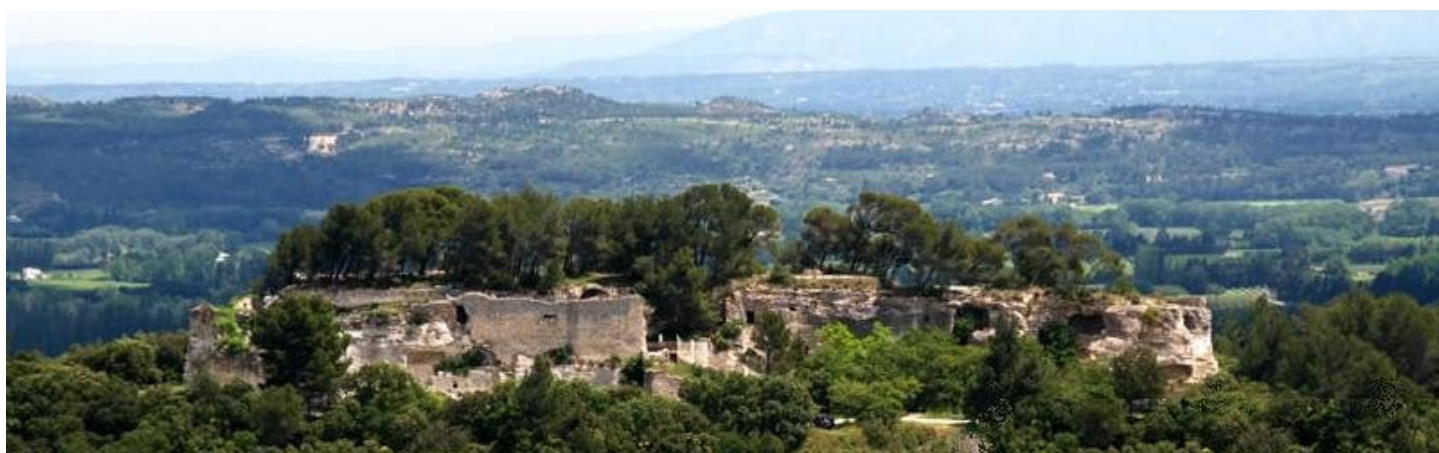
L'abbaye de Saint Roman sur son piton calcaire

L'après-midi ensoleillé et venté sera consacré à l'Abbaye de Saint Roman située aux alentours de Beaucaire sur un piton calcaire d'où l'on jouit d'une superbe vue du Rhône et de son dernier affluent, le Gardon, avant la Camargue et la mer!