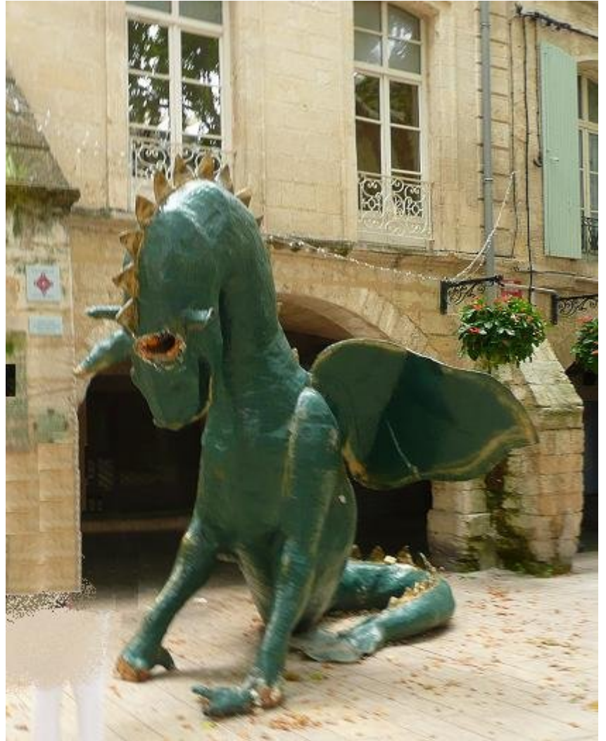
Le Drac de Beaucaire ou l'ogre du Rhône