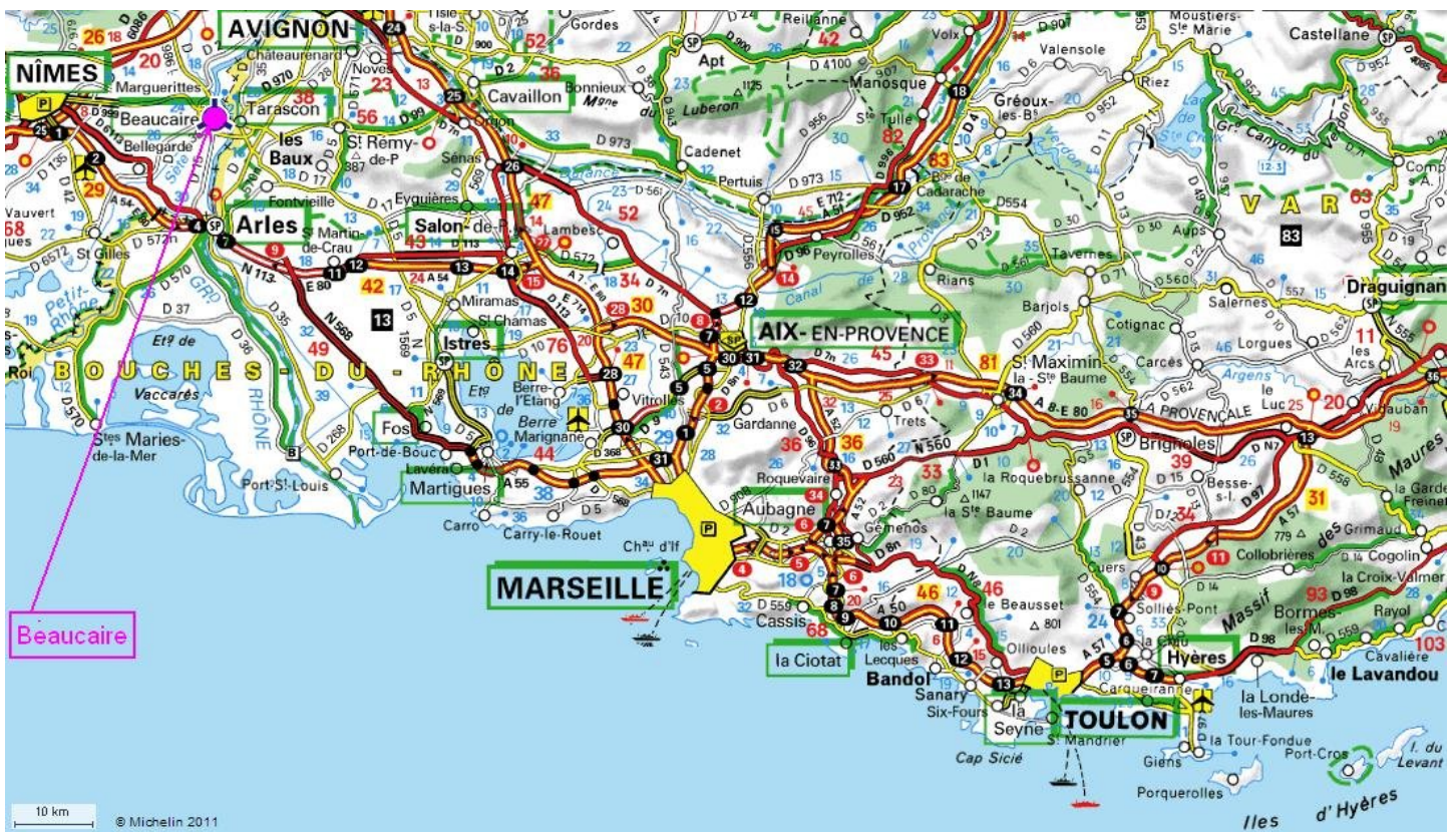
Extrait de la carte Michelin : Beaucaire entre Nîmes, Arles et Avignon

Cette sortie a consisté en une visite le matin du centre ancien de la ville de Beaucaire classée "Ville d'art et d'histoire". L'après-midi a été consacré à la visite de l'abbaye troglodyte de Saint Roman.