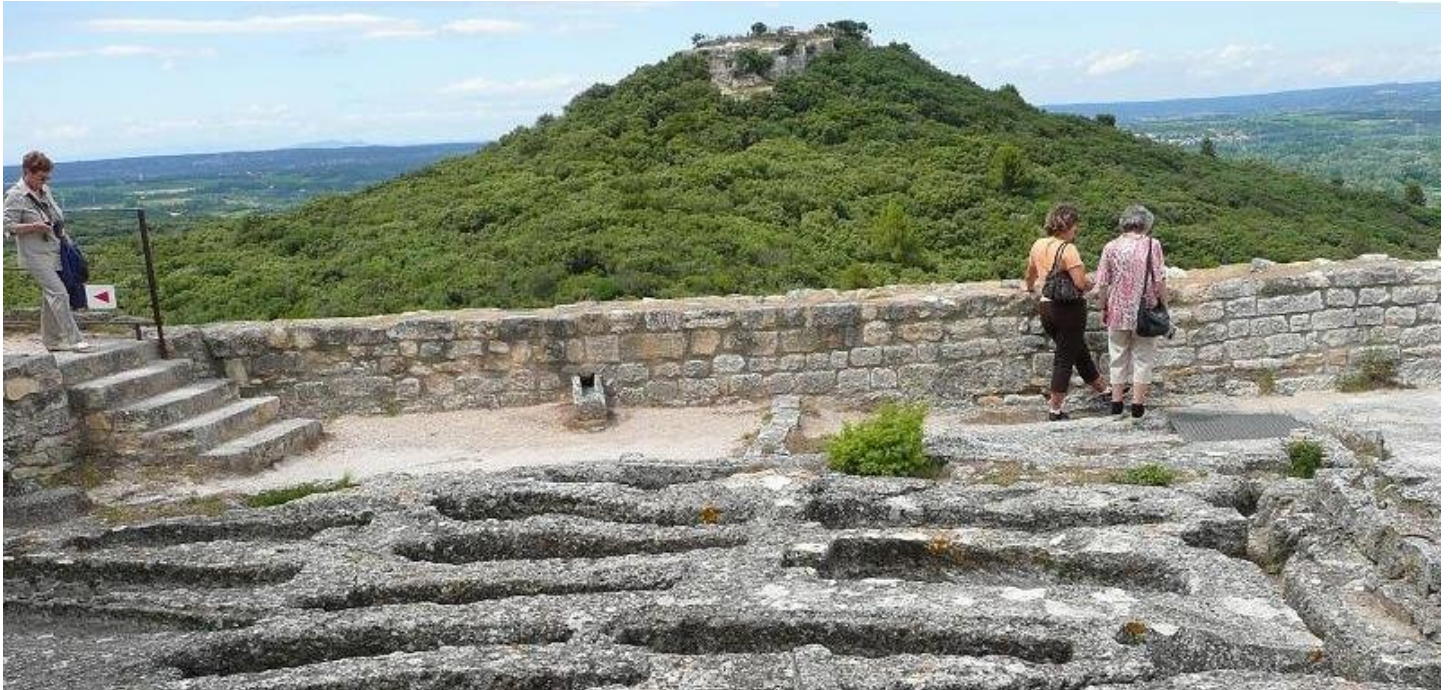
Ces tombes taillées dans la roche ne sont pas des baignoires !

L'abbaye de Saint Roman est connue également pour ses tombes taillées dans la roche et que des visiteurs sans guide, mal inspirés, avaient pris ... pour des baignoires!!! Nous visitons les cellules et autres lieux habitables au confort des plus sommaires : une simple paille au sol, une anfractuosité dans le calcaire comme "placard" et un emplacement pour la lampe à huile car il n'y a pas de fenêtre, ce qui permet une température régulière et l'absence de courants d'air mauvais pour la santé!