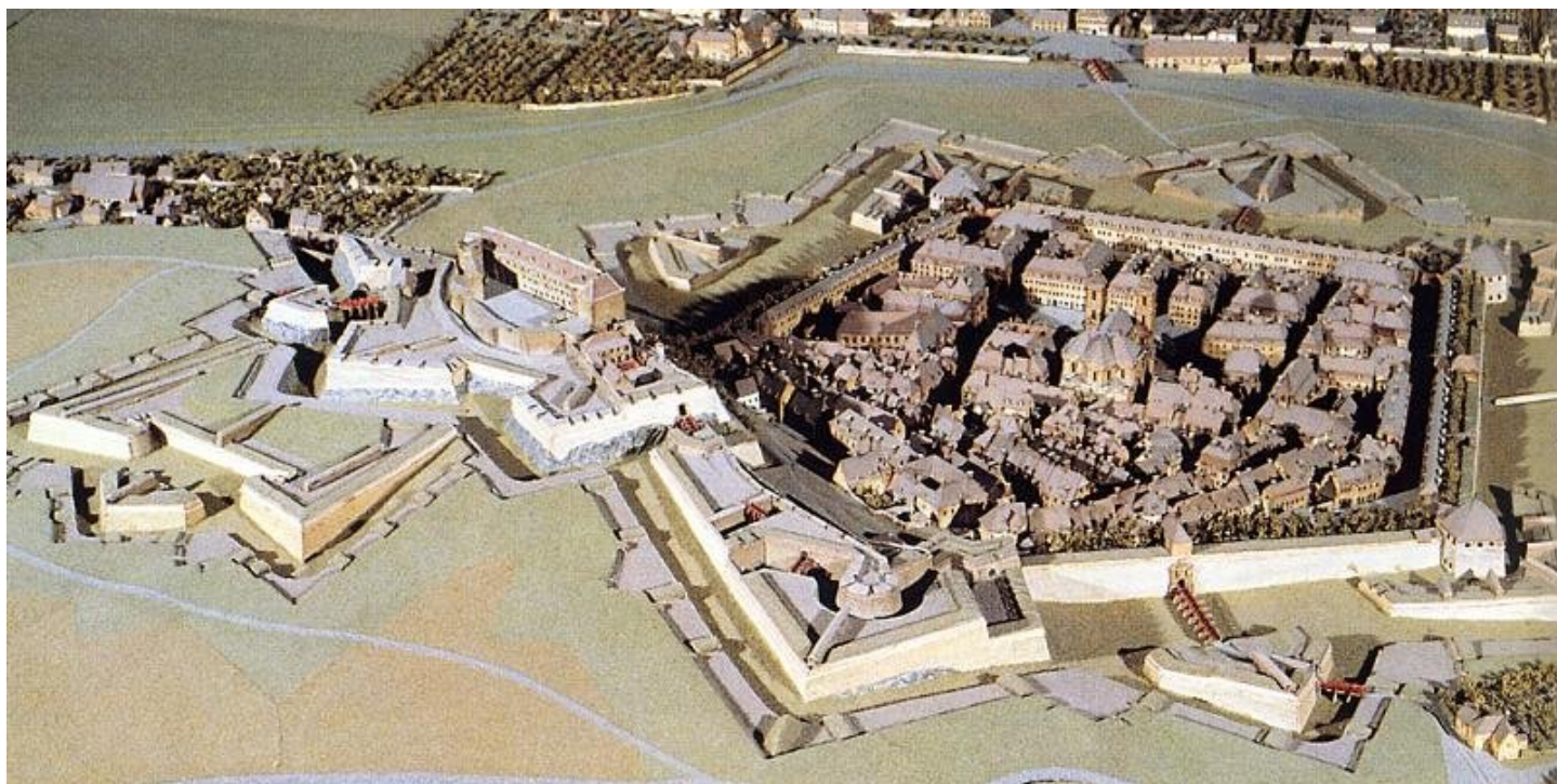
Plan-relief de Belfort

En 1815 les Prussiens entrent dans Paris. Ils emportent à Berlin 19 plans-reliefs de places du nord et de l'est. Au début du XX ème siècle Guillaume II met en dépôt dans les villes concernées les plans de Strasbourg, Landau, Bitche et Thionville. Les autres seront retrouvés à Berlin après la fin de la seconde guerre mondiale. Leur mauvais état les rend irrécupérables, sauf celui de Lille, rapatrié en 1948.