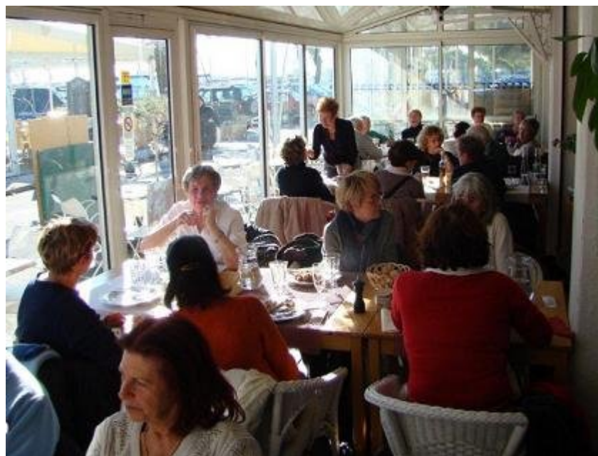
Enfin un peu de chaleur après ces visites dans un froid glacial...