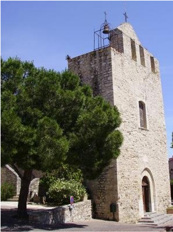
L'église Saint Sauveur