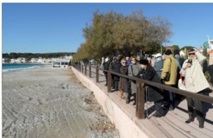
En haut le nouveau quartier de la Rambla créé en 2000, en bas à gauche la Statue de la Liberté trône devant l'église et à droite nous arrivons aux Lecques pour déjeuner en bord de mer...