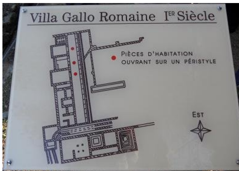
Plan de la villa de Tauroentum

Des écrivains postérieurs comme Millin (1759-1818), archéologue et professeur d'histoire à Paris, pensaient voir à cet endroit juste les ruines d'une grande villa gallo-romaine et non une ville. Millin fut un des premiers auteurs de la contestation. En 1959, ce fut le tour de Jean Layet qui écrivait dans le bulletin de l'Académie du Var: " Tauroentum était au Brusç ". Pour lui, deux quartiers du Brusç étaient riches du point de vue archéologique : le quartier nommé La Citadelle et celui du Vallon . Sous celui de La Citadelle fut effectivement découvert une fraction d'aqueduc attribué aux grecs de Marseille.