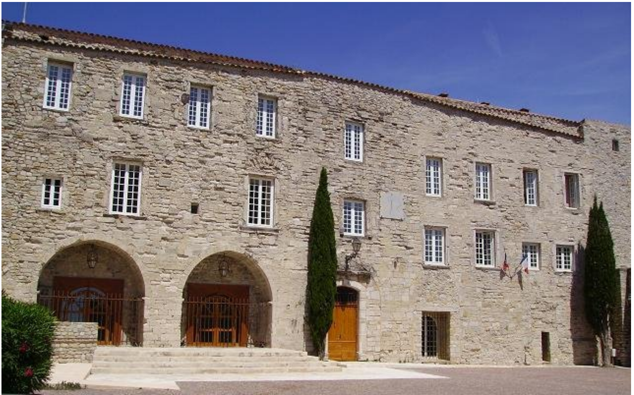
Le château abrite maintenant la mairie et des salles d'exposition