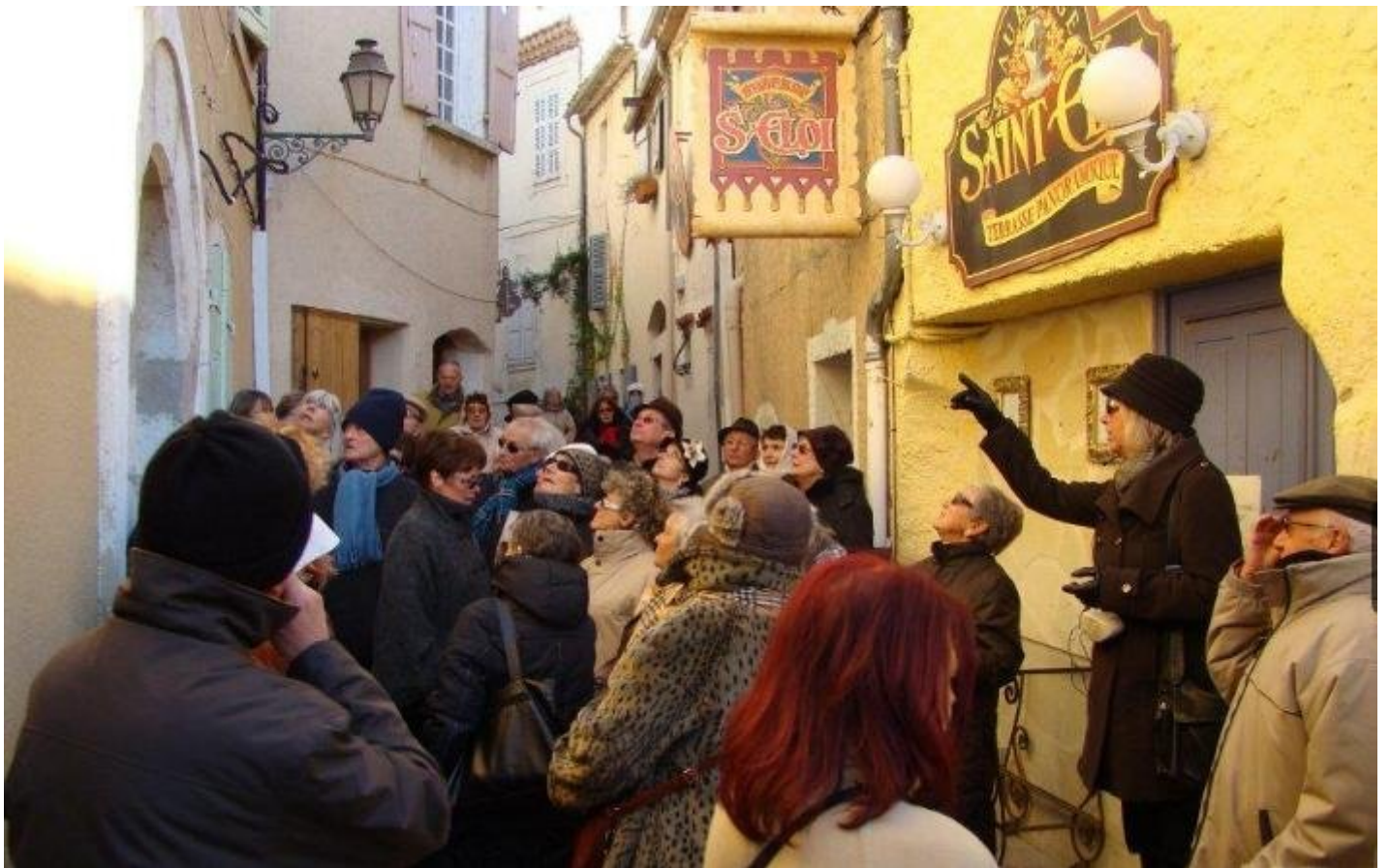
Notre groupe très attentif, malgré le froid, aux explications de la guide...