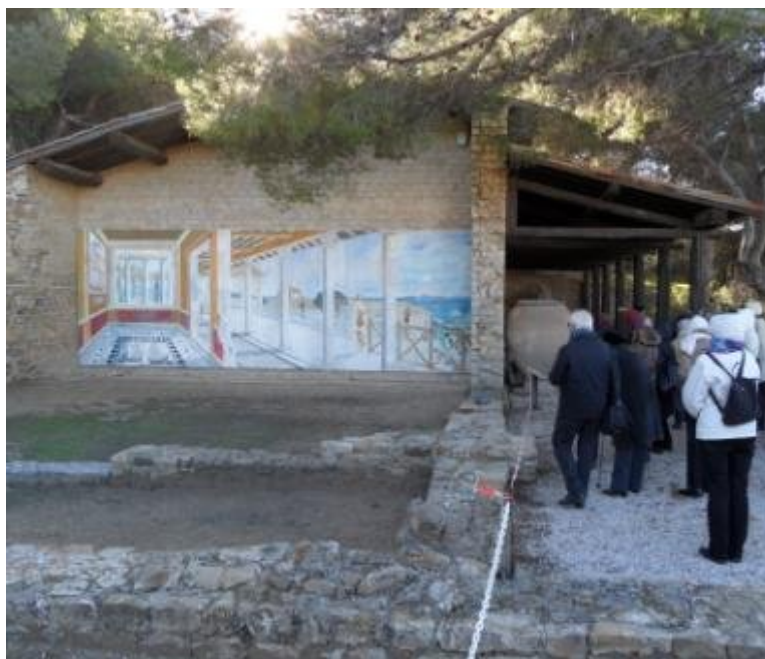
Le musée avec une représentation en trompe-l'oeil

Un musée fut construit en 1965-66 sur une partie de l'emplacement de la villa primitive, ainsi, les mosaïques sont sauvegardées et visibles sur les lieux-mêmes de leur découverte.