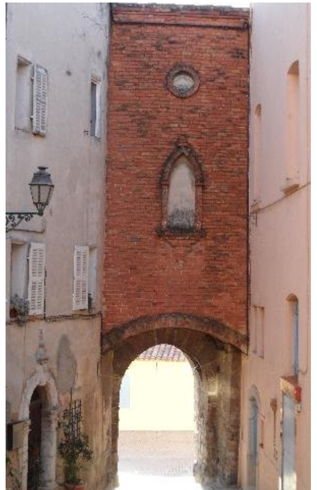
Le grand Portail

Toute proche, l'église de la Transfiguration du Saint Sauveur que nous avons visitée communiquait autrefois avec le château par une porte et une fenêtre d'où le seigneur pouvait assister aux offices. Toutes deux sont obturées. La construction est de style roman du 12ème siècle pour la nef principale qui est composée de trois travées avec arcatures latérales à doubles rouleaux. Comme les villageois étaient fort nombreux et ,bien sûr, très pratiquants, une nef secondaire fut adjointe au 18ème siècle pour les accueillir dans cette petite église qui fut soigneusement restaurée dernièrement.