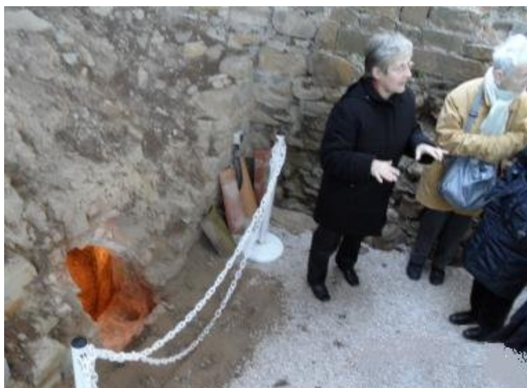
Le four d'un potier

Il faut entendre par " Villa Maritima " : " domaine au bord de mer ". Il abritait plusieurs milliers de personnes ( les maîtres, les serviteurs, les esclaves, les artisans, les pêcheurs, commerçants...).