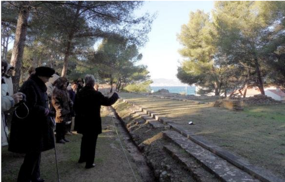
La villa allait jusqu'à la mer ; ici le péristyle et l'impluvium

Érigée sur un promontoire rocheux, la villa de Tauroentum, ancienne demeure romaine, daterait de la seconde moitié du 1er siècle avant Jésus Christ. Un musée fut bâti au-dessus en 1966.