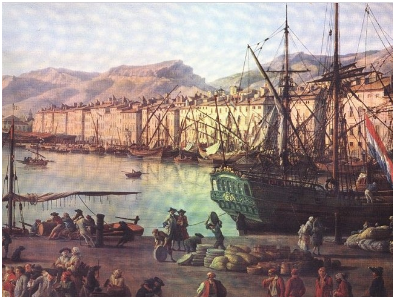
Vue du port de Toulon - huile sur toile par Vernet

Il concède en 1595 aux toulonnais les terrains susceptibles d'être gagnés sur la mer et précise qu'une partie de ces terrains seront destinés à la construction d'un arsenal ! En 1610 installation des premières galères En 1631 Richelieu décide que l'Etat entretiendra les vaisseaux dans des arsenaux. (jusqu'ici c'étaient les capitaines qui en avaient la charge). Toulon devient le premier établissement militaire en Méditerranée. En 1650 l'agrandissement du port est une nécessité car la vieille Darse se révèle insuffisante vu l'augmentation croissante du tonnage !