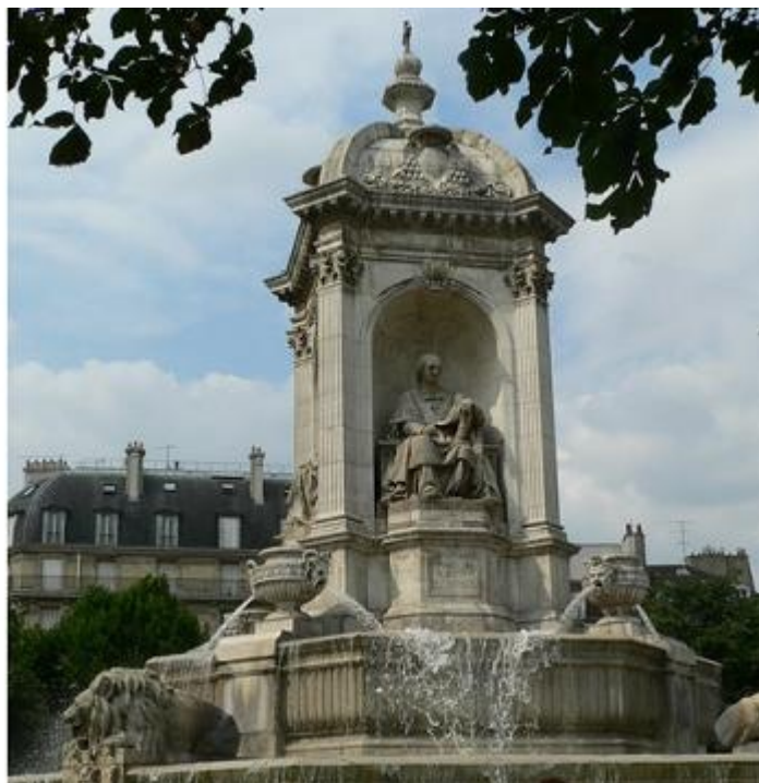
Statue de Massillon ornant la fontaine Saint Sulpice à Paris

Sont également mentionnés et détaillés le Palais de Justice, l'hôpital, la caserne, le théâtre Denis donnant 2 représentations par semaine, la poste et même un Hammam à proximité. La célèbre épicerie fine de Paris "Félix Potin" avait un magasin à Hyères. Enfin un orphelinat était situé rue du repos (en référence à un ancien cimetière à proximité)!