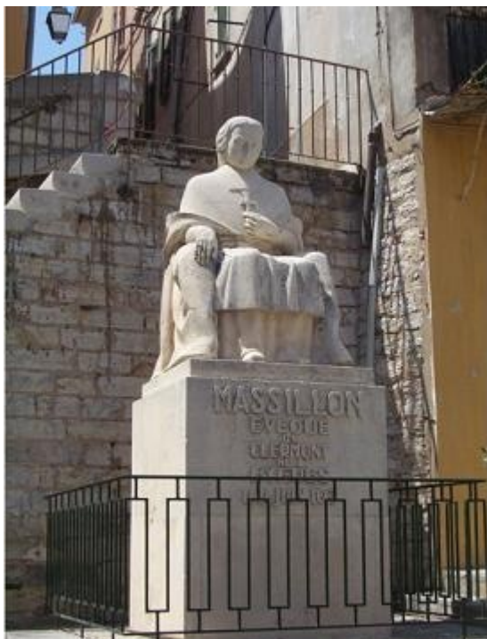
Statue de Massillon, place de la République à Hyères

Massillon, orateur prélat célèbre, avait sa statue (fondue lors de la dernière guerre) place de la République.