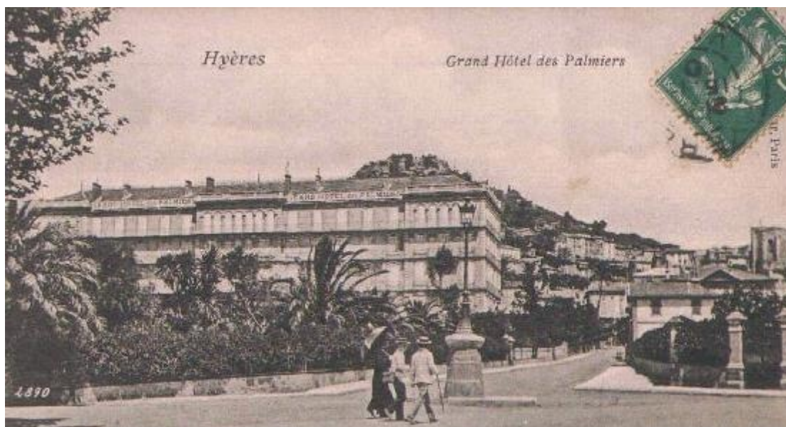
Grand Hôtel des Palmiers vers 1900

Les établissements hôteliers offraient toutes les prestations souhaitables pour les plus riches mais aussi pour ceux de condition moins fastueuse si l'on en juge par la modicité des prix de pension demandés!