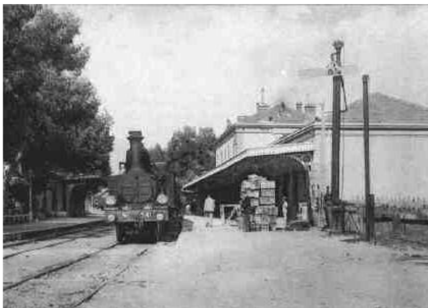
Gare de Hyères vers 1900 (voir http://www.chez.com/hyeres/cpostal.html )

Il y eut deux lignes de chemin de fer et la médiathèque actuelle se trouve sur l'emplacement exact d'une ancienne gare. A ces deux lignes s'ajoutait un tramway qui semble être de nouveau le désir de nos édiles de TPM.