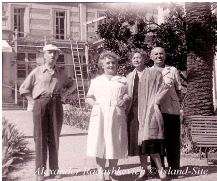
Alexander Radashkevich

Georges Ivanov, le plus grand poète de l'émigration s'est éteint à Hyères en 1958.