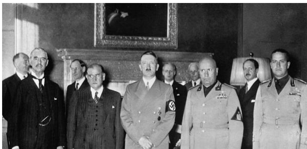
Accords de Munich, la conférence mythique, au premier rang à gauche Chamberlain puis Daladier puis Hitler et enfin Mussolini. Au deuxième rang à droite de Mussolini Alexis Leger*

Pour avoir empêché la guerre, ces hommes politiques seront acclamés par leur peuple lors de leur retour dans leur pays.