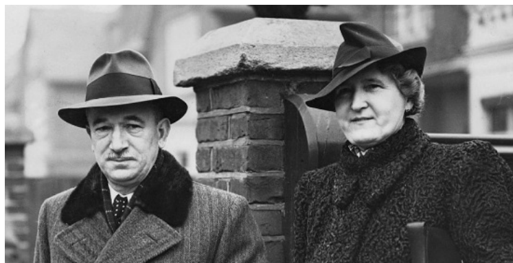
La crise des Sudètes. Le Président de la Tchécoslovaquie et son épouse.

La crise interne tchécoslovaque devient cause de guerre pour l'Europe.