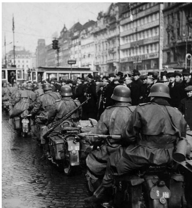
L'occupation de Prague en mars 1939

Il se produit une exaspération suite aux ambitions démesurées d'Hitler et un revirement complet de situation des grandes puissances qui décident de s'opposer à l'Allemagne et soutenir la Grèce, la Pologne et la Roumanie.