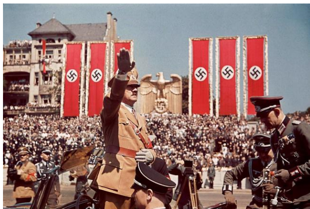
Hitler en 1938 : l'apogée du Nazisme

Cependant ni la Grande Bretagne, ni la France qui avait pourtant signé un accord pour le maintien des frontières avec la Tchécoslovaquie ne s'engagent aux cotés de la Tchécoslovaquie.