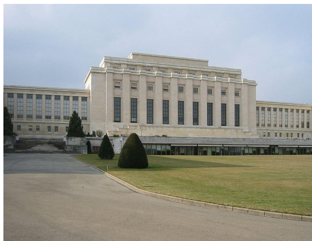
Palais de la Société des Nations à Genève