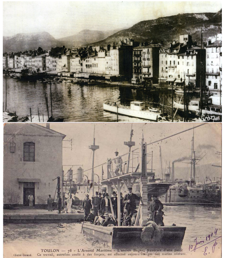
Toulon Le quai et L'arsenal