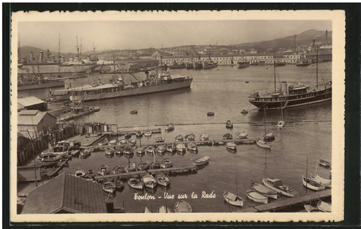
Vue aérienne de la Rade

Dans un dernier volet, Bernard CROS présenta des clichés des années 1910/1914 avec en particulier les travaux de construction de deux bassins de radoub et l'ouverture pour les réaliser d'une carrière sur le flanc du Mont Faron, d'autres clichés datant des années 1920/1925, avec le grand bassin Vauban ainsi que l'espace exigu laissé au port de commerce.