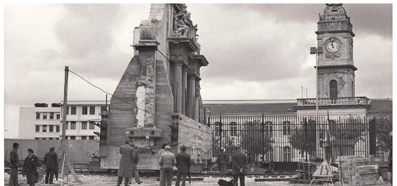
Déplacement porte de l'Arsenal en 1976

Le conférencier attirera plus particulièrement l'attention, sur la statue du « génie de la navigation (monsieur du Cuverville), installée sur le quai ainsi que sur la grande porte de l'Arsenal à son emplacement primitif avant son déplacement en 1976. Il rappelle que les deux colonnes de marbre encadrant l'entrée étaient venues de Grèce en 1686, à l'initiative d'un ministre de Louis XIV. La Préfecture Maritime située sur la place d'Armes, détruite lors de la Seconde Guerre Mondiale, n'est arrivée jusqu'à nous que par la photographie, il en est de même pour le bâtiment de la Consigne qui abritait le service de la « quarantaine sanitaire ».