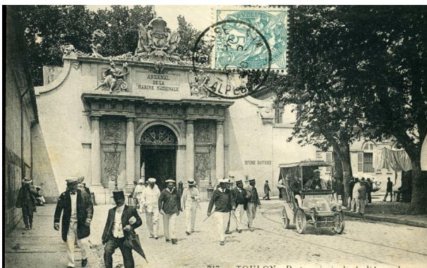
Porte de l'Arsenal

Le conférencier a rappelé d'abord le rôle de Louis DAGUERRE, imaginant en 1822 le diorama puis réalisant en 1838 le daguerréotype ouvrant la voie à la photographie. Le premier cliché connu de Toulon est une vue de la darse datant de 1845. Une autre grande invention, celle de l'aviation, elle va permettre à partir de 1910 d'ajouter un élément supplémentaire. Les premières photographies aériennes réalisées au-dessus de Toulon ont permis à Bernard CROS de localiser, l'arsenal, les casernes et les magasins, la darse Vauban, les autres bassins, la place d'Armes avec l'ancienne préfecture maritime, la vieille ville et les fortifications. Il pourra ensuite revenir en détail, à l'aide des clichés, nombreux à partir de 1860, sur le port de guerre à l'époque de Napoléon III et des débuts de la III ème République. Ainsi avons-nous vu, entre autres, certains bâtiments du bagne (fermé seulement définitivement en décembre 1873), le parc d'artillerie et celui de munitions, la corderie, le parc à charbon, les impressionnants appareils de transbordement, les casernes du Mourillon, le fort Saint-Louis, les rochers de la Mitre.