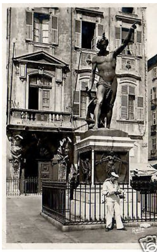
Le génie de la navigation

En conclusion, sera souligné le rôle essentiel des collectionneurs acceptant de participer au devoir de mémoire.