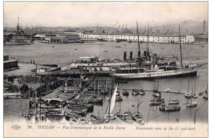
La vieille darse 1912

Le conférencier a rappelé d'abord le rôle de Louis DAGUERRE, imaginant en 1822 le diorama puis réalisant en 1838 le daguerréotype ouvrant la voie à la photographie. Le premier cliché connu de Toulon est une vue de la darse datant de 1845. Une autre grande invention, celle de l'aviation, elle va permettre à partir de 1910 d'ajouter un élément supplémentaire. Les premières photographies aériennes réalisées au-dessus de Toulon ont permis à Bernard CROS de localiser, l'arsenal, les casernes et les magasins, la darse Vauban, les autres bassins, la place d'Armes avec l'ancienne préfecture maritime, la vieille ville et les fortifications. Il pourra ensuite revenir en détail, à l'aide des clichés, nombreux à partir de 1860, sur le port de guerre à l'époque de Napoléon III et des débuts de la III ème République. Ainsi avons-nous vu, entre autres, certains bâtiments du bagne (fermé seulement définitivement en décembre 1873), le parc d'artillerie et celui de munitions, la corderie, le parc à charbon, les impressionnants appareils de transbordement, les casernes du Mourillon, le fort Saint-Louis, les rochers de la Mitre.