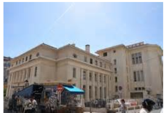
Poste Centrale Toulon

Hormis le style géométrique les constructions " Arts Décos " se distinguent par des détails architecturaux et des décorations caractéristiques (mélangeant parfois, à Toulon, des apports de style provençal ).