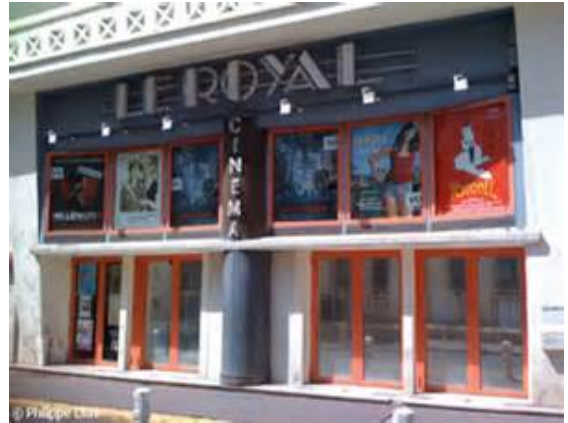
Cinéma Le Royal Toulon