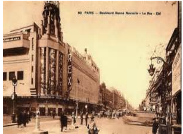
Grand Rex Paris