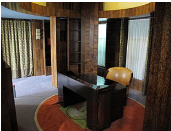
bureau bibliothèque de P. Chareau