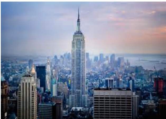
Empire State Building