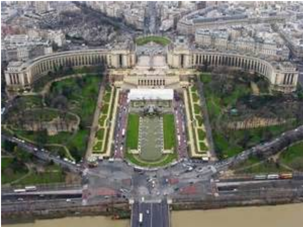
Palais de Chaillot Paris