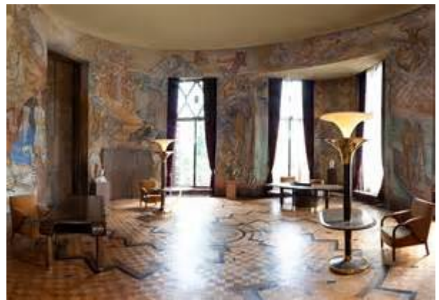
salon du Maréchal Lyautey