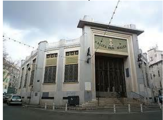
Halle Municipale Toulon