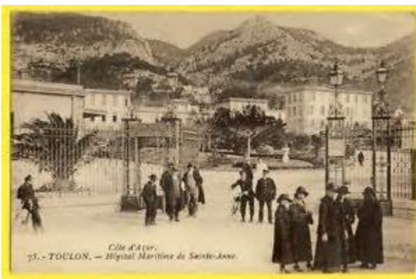
Hôpital Ste Anne Toulon