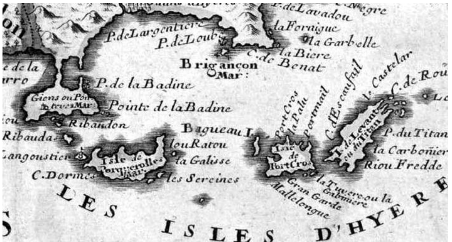
Carte de Jean-Nicolas de Tralage, 1707