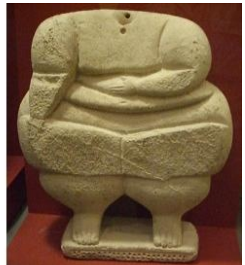
Déesse de la fécondité