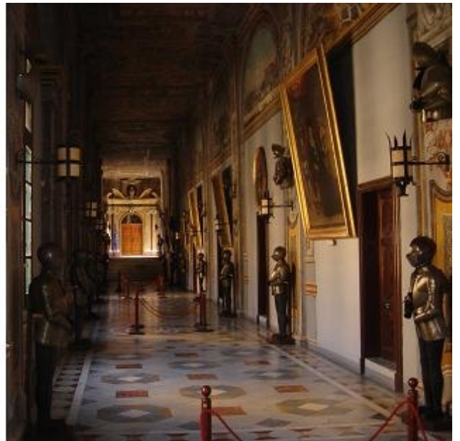
Extérieur et intérieur du Palais du Grand Maître de l'Ordre de Malte

Les géographes admettent que l'archipel maltais formait un isthme reliant Europe et Afrique. L'île était-elle donc européenne ou africaine? Les grands maîtres de l'ordre, jaloux de leur souveraineté s'estimaient " à part ".