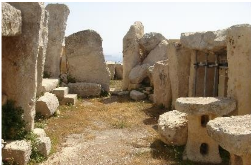
Le temple mégalithique de Hagar Qim

L'occupation humaine remonte à l'homme de Néanderthal et les grands temples édifés, un peu avant l'époque des grandes pyramides d'Egypte sont, peut-être, les structures les plus anciennement érigées dans le monde.