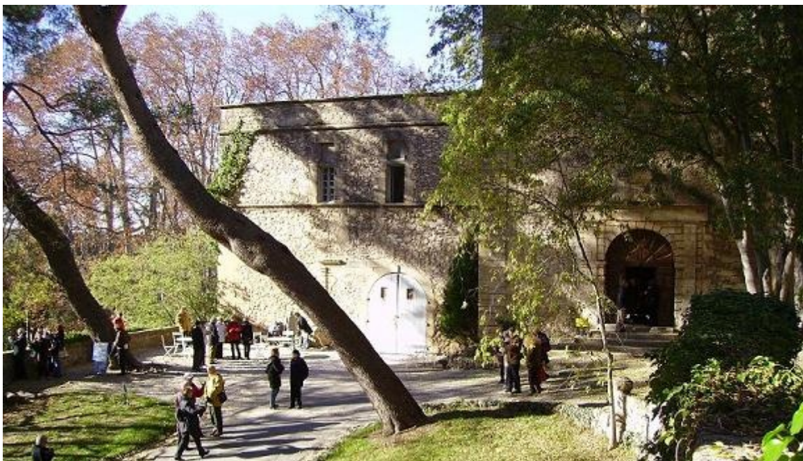
L'entrée du château

En 1963 le marquis de Forbin vendit cette propriété à un de ses amis M André Pons . Celui-ci, ingénieur agricole, l'aménagea très vite afin de l'ouvrir au public. Actuellement ce sont les enfants de M Pons qui y résident et qui organisent les visites. Quelques chambres pourvues d'une salle de bain moderne et donnant sur terrasse sont louées comme chambres d'hôtes. Un vivarium est installé dans l'ancienne bergerie et un parc zoologique est aménagé sur une trentaine d'hectares parmi la végétation méditerranéenne, pour le plaisir de nombreux enfants.