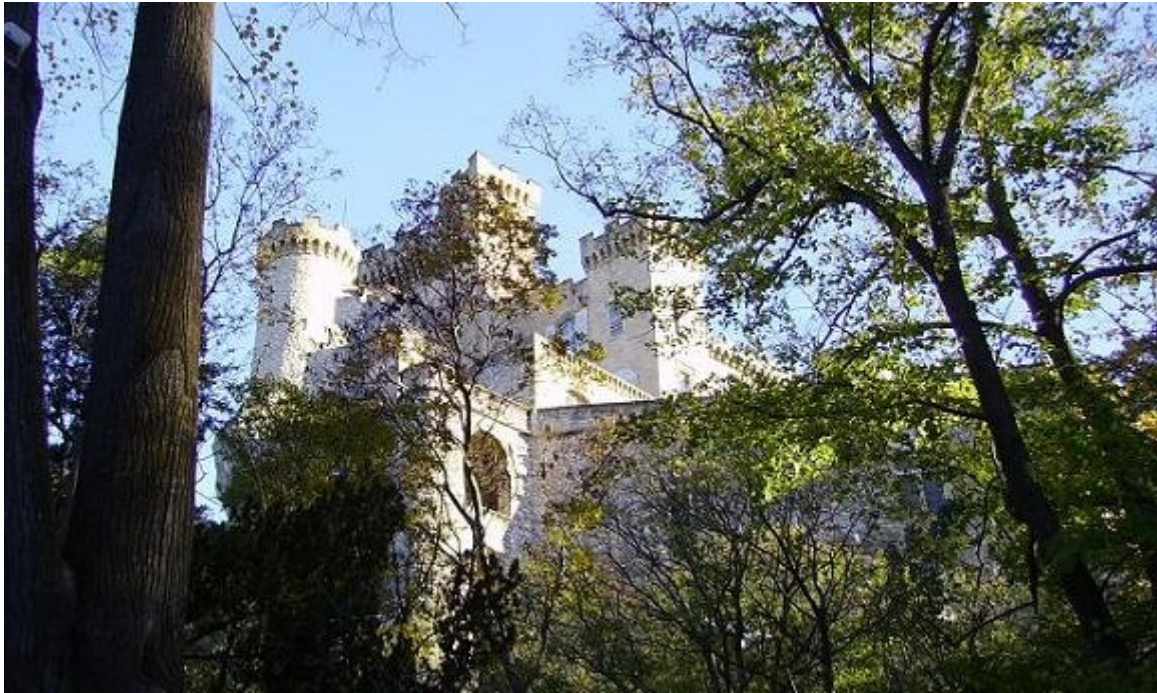
Le château vu depuis l'entrée des jardins.

Le château fut agrandi à plusieurs reprises au cours du 14ème et surtout du 17ème siècle pour le transformer en demeure de plaisance. En 1909 un tremblement de terre qui secoua la région fit quelques dégâts. La tour ouest dite " Palamède " fut détruite, le sol de la cuisine du rez de chaussée fut ébranlé. Deux ans plus tard, les propriétaires firent reconstruire la tour sur le même rocher.