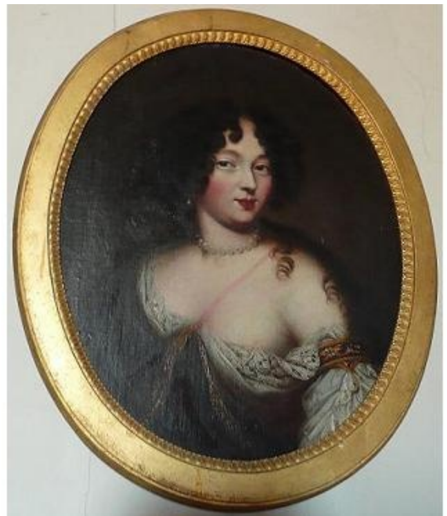
A gauche : Marie de Rabutin-Chantal marquise de Sévigné - A droite : sa fille Françoise Marguerite De Grignan

De nombreuses peintures présentes dans ce château sont dues au célèbre peintre Marius Granet , ami d'Auguste Forbin. Peintures ou meubles ont eu la chance de n'avoir connu que le tremblement de terre de 1909, car le château fut épargné par la révolution et par les deux derniers grands conflits du 20 ème siècle.