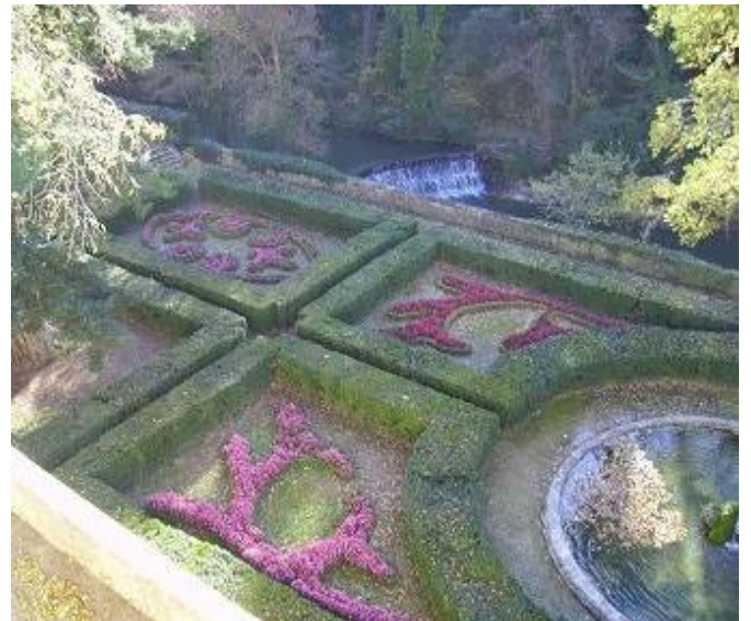
Quelques vues des jardins

En contrebas du château, le jardin de type classique à la française, est composé de 7 parterres de buis répartis autour d'un bassin circulaire. Au centre de l'un de ces parterres se dresse un séquoia géant rapporté d'Amérique à la suite de la guerre d'indépendance.