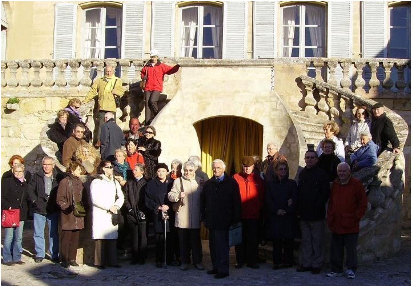
Notre groupe devant l'escalier de la cour d'honneur