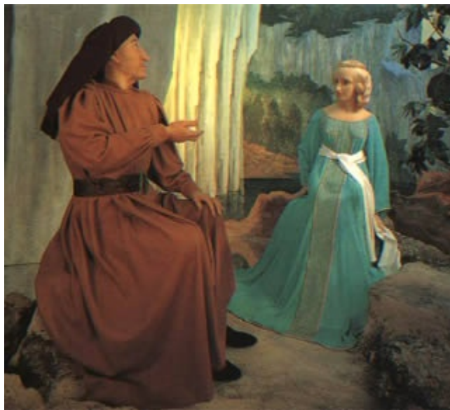
Un élément de la scène 7

Scène 7 : A la cour d'Aix en 1240. On y présente les filles du comte de Provence. Celles-ci épouseront les rois de France d'Angleterre et de Rome. Les plus connues pour nous sont Marguerite épouse de Louis IX (= Saint Louis) et Béatrix épouse de Charles d'Anjou frère du roi de France.