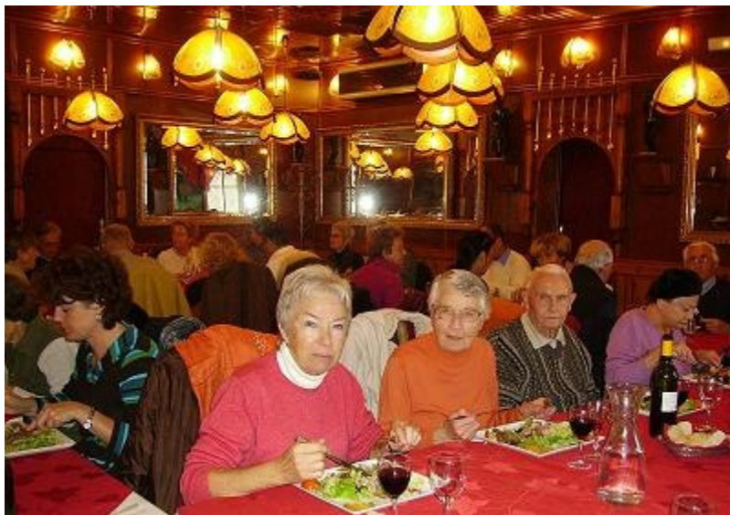
Déjeuner au restaurant "La Table d'Oscar"

Située à peu de distance de Marseille et d'Aix en Provence, la petite ville de Salon de Provence est surtout connue à l'échelon national pour sa patrouille de France et son école de l'air. Le 27 octobre 2007, nous avons visité son centre historique dont le Château de l'Empéri, qui est peu visible de loin contrairement à celui de La Barben situé dans un environnement plus grandiose.