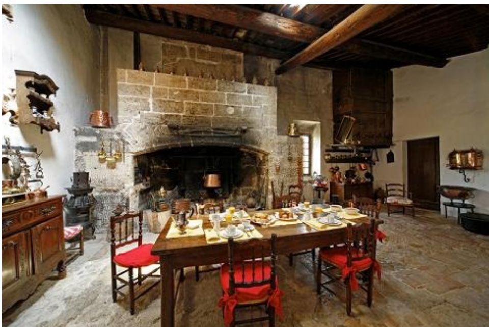
La cuisine médiévale

Le château comprend une soixantaine de pièces, chacune très différente par son architecture ou sa décoration. La visite s'est faite en deux groupes distincts, un groupe sous la conduite du propriétaire et un autre dont je faisais partie sous la conduite d'une guide sympathique et très intéressante pour ses connaissances historiques.