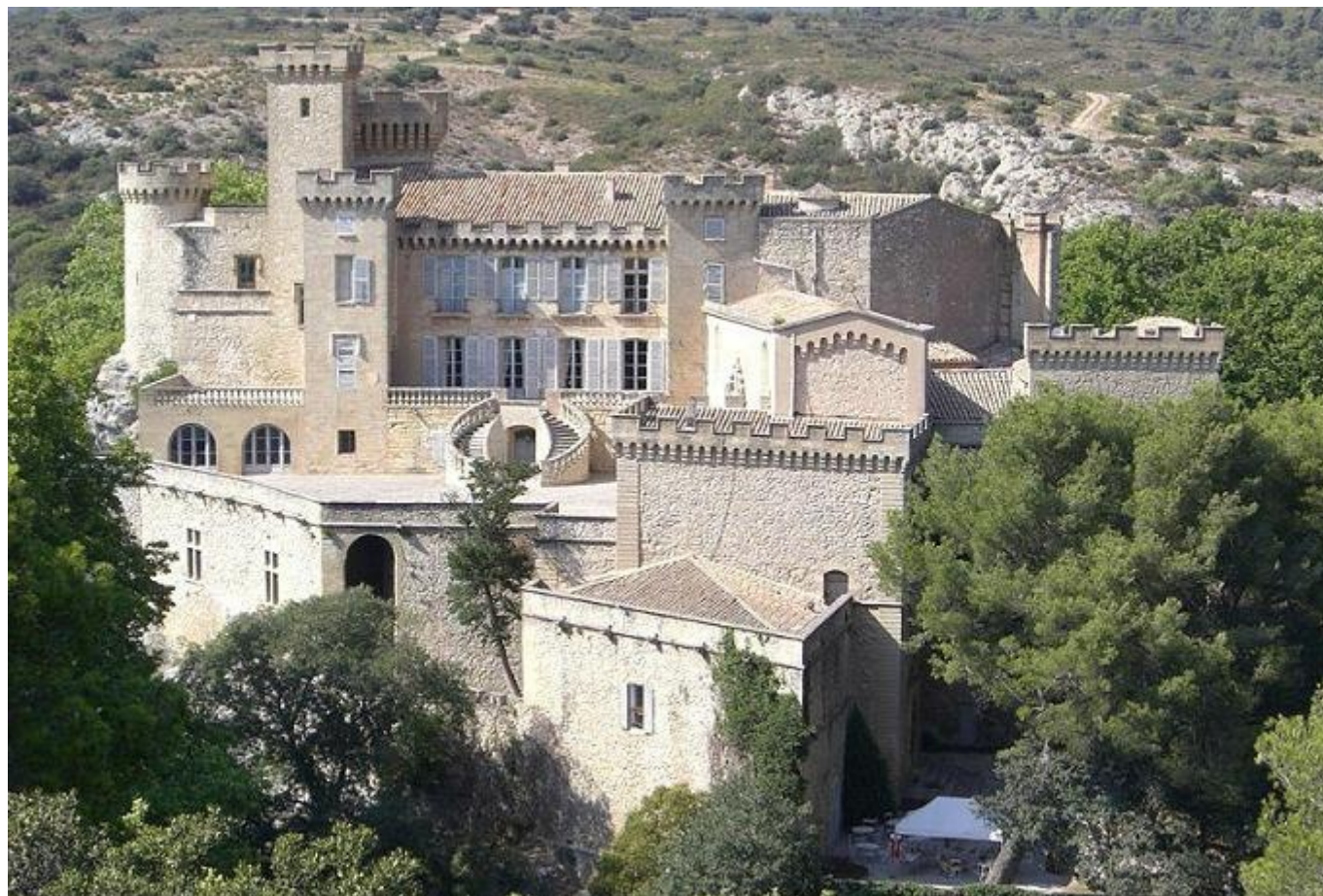
Le Château de La Barben vu depuis l'éperon rocheux qui lui fait face.

La Barben est située à six kilomètres à l'est de Salon de Provence dans le vallon du Touloubre. Le Touloubre est un petit cours d'eau de 59 km qui naît entre Aix et Salon et qui se jette dans l'étang de Berre.