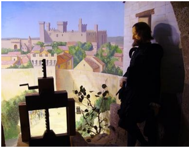
Scène 10 : Craponne

Scène 10 : Scène très importante pour La Crau : L'arrivée des eaux à Salon de Provence.