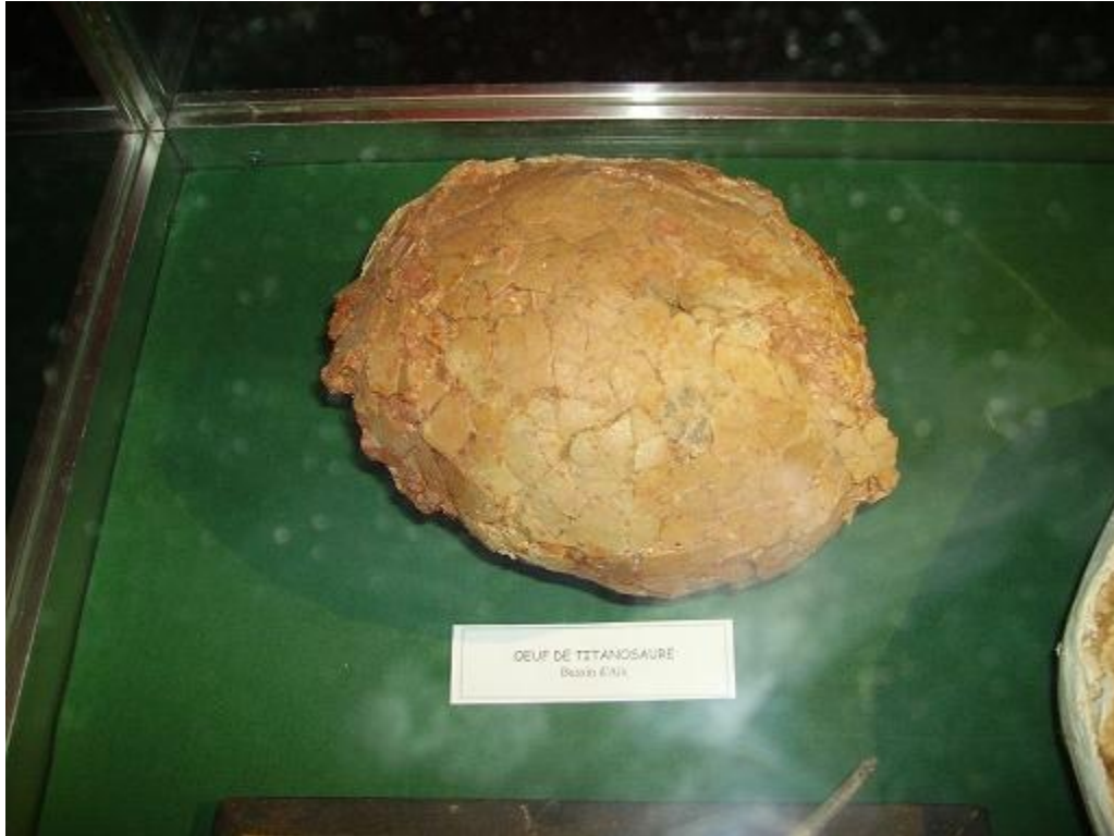
Œuf de Titanosaure du Bassin d'Aix en Provence

Tous sont de vrais ossements sauf l'ostéoderme de titanosaure (plaque osseuse sous la peau).